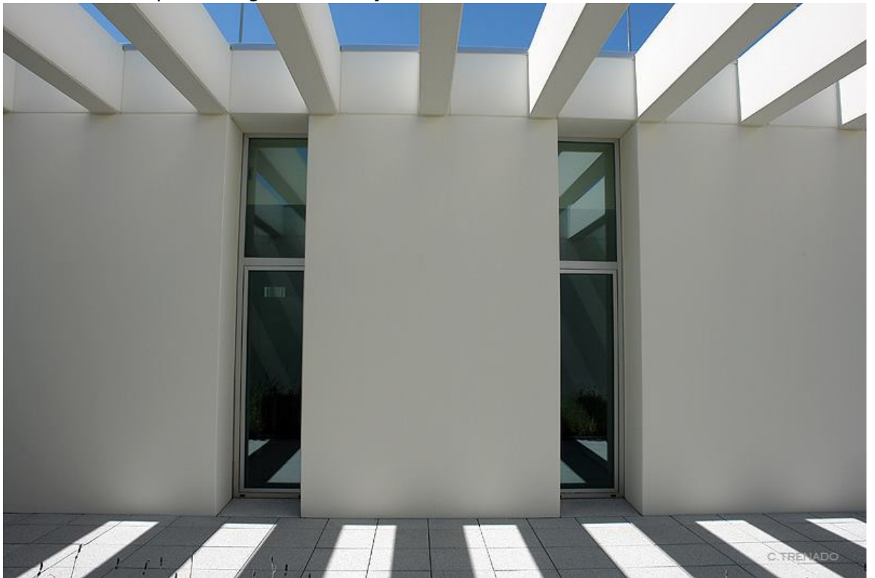
HUM740: Memoria y Lenguaje