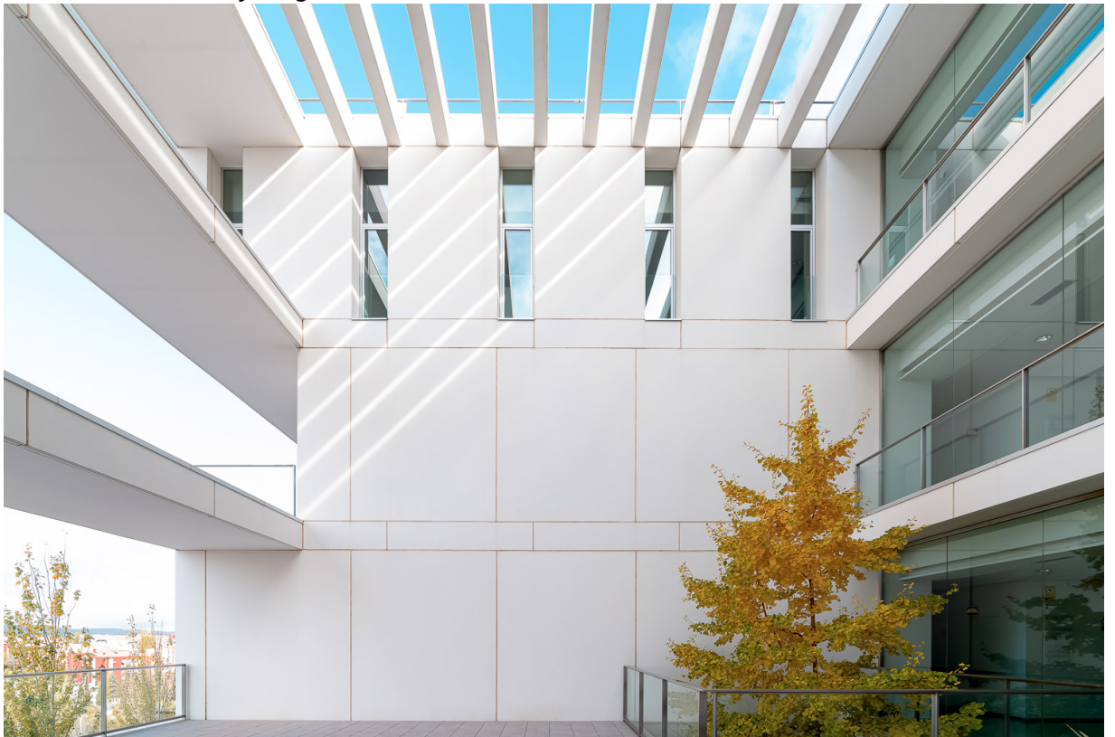
HUM1049: Evaluación e Intervención psicoeducativa de las necesidades específica...