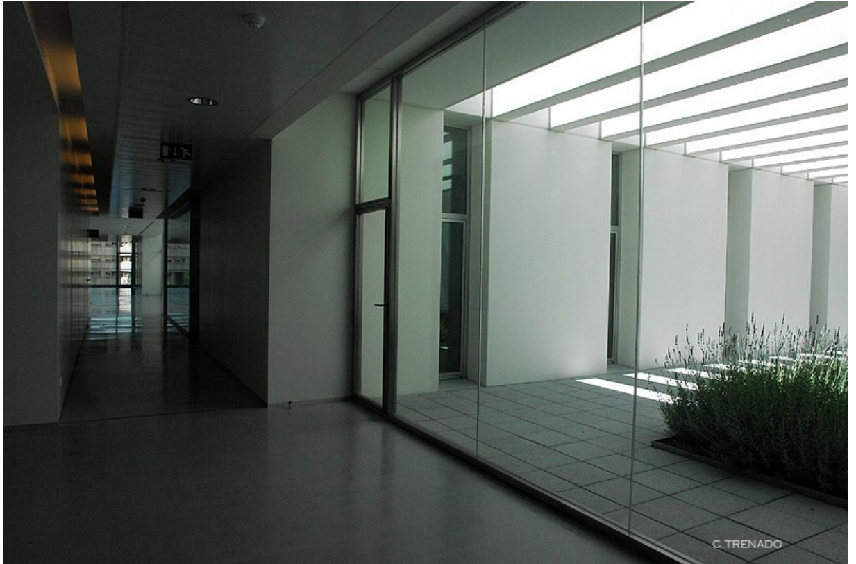
CTS436: Aspectos Psicosociales y Transculturales de Salud y Enfermedad