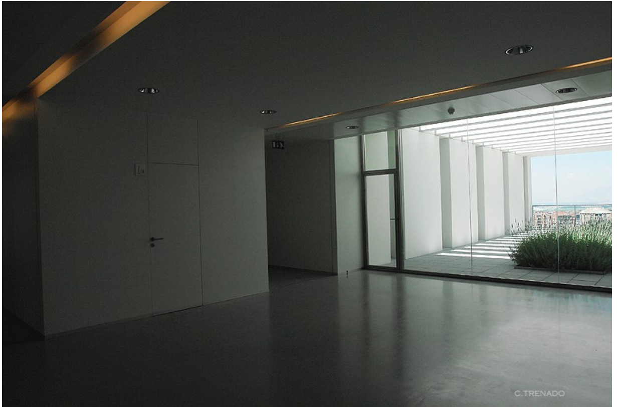
CTS261: Psicofisiología Clínica y Promoción de la Salud