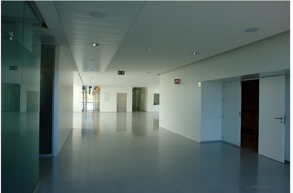
CTS-1067: Procesamiento de la Información y Toma decisiones en Ciencias de la S...