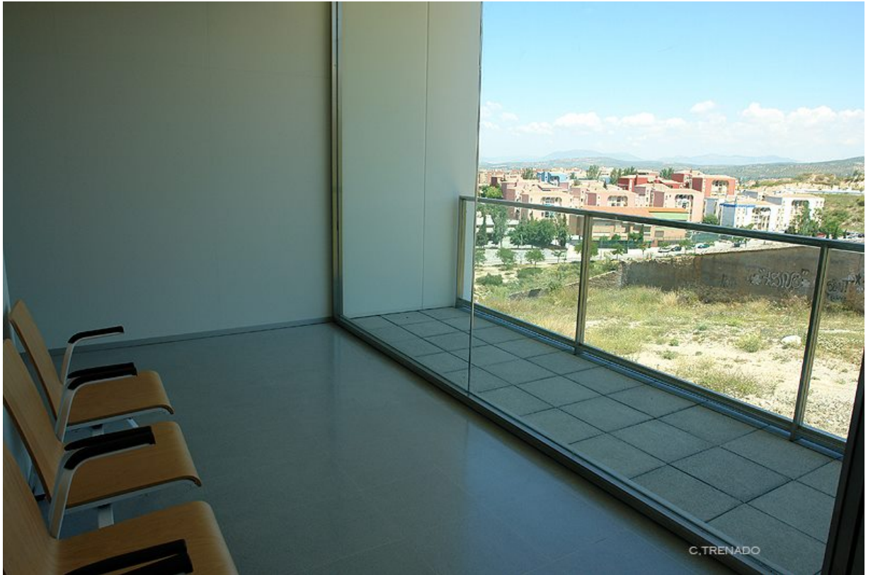
HUM624: Modelización y Medición del Comportamiento Humano