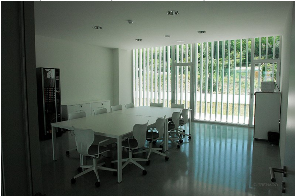
CTS581: Neuropsicología y Psiconeuroinmunología Aplicadas