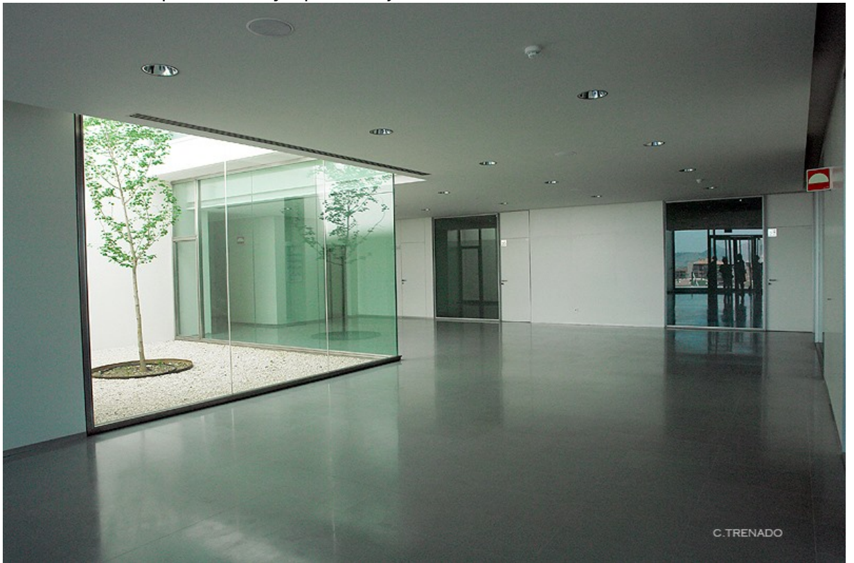
HUM129: Análisis Experimental y Aplicado del Comportamiento