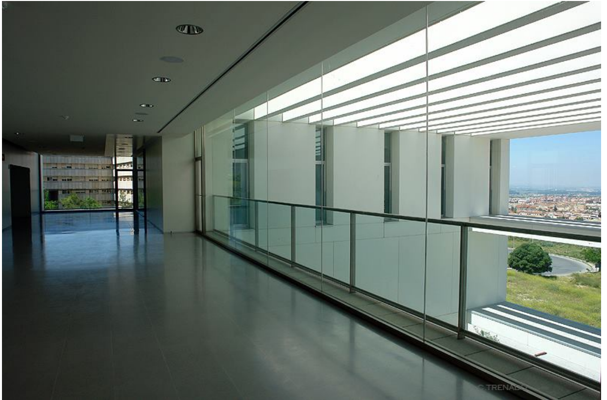
CTS1003: Neuroplasticidad y Aprendizaje