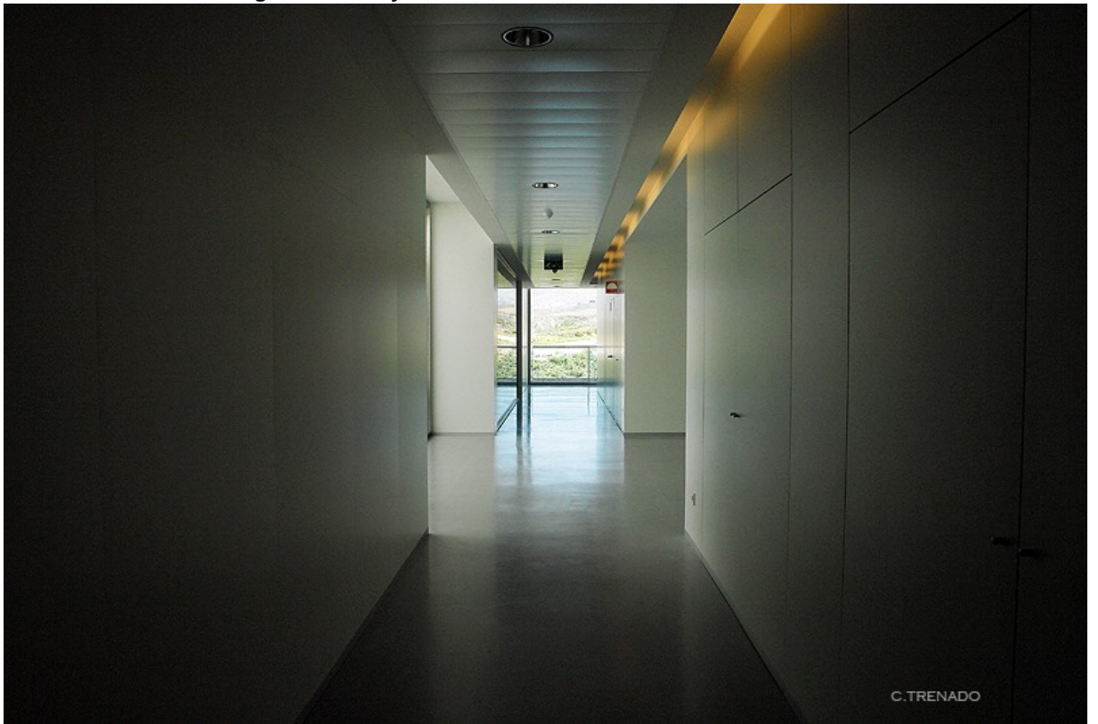
CTS267: Psicología de la Salud y Medicina Conductual