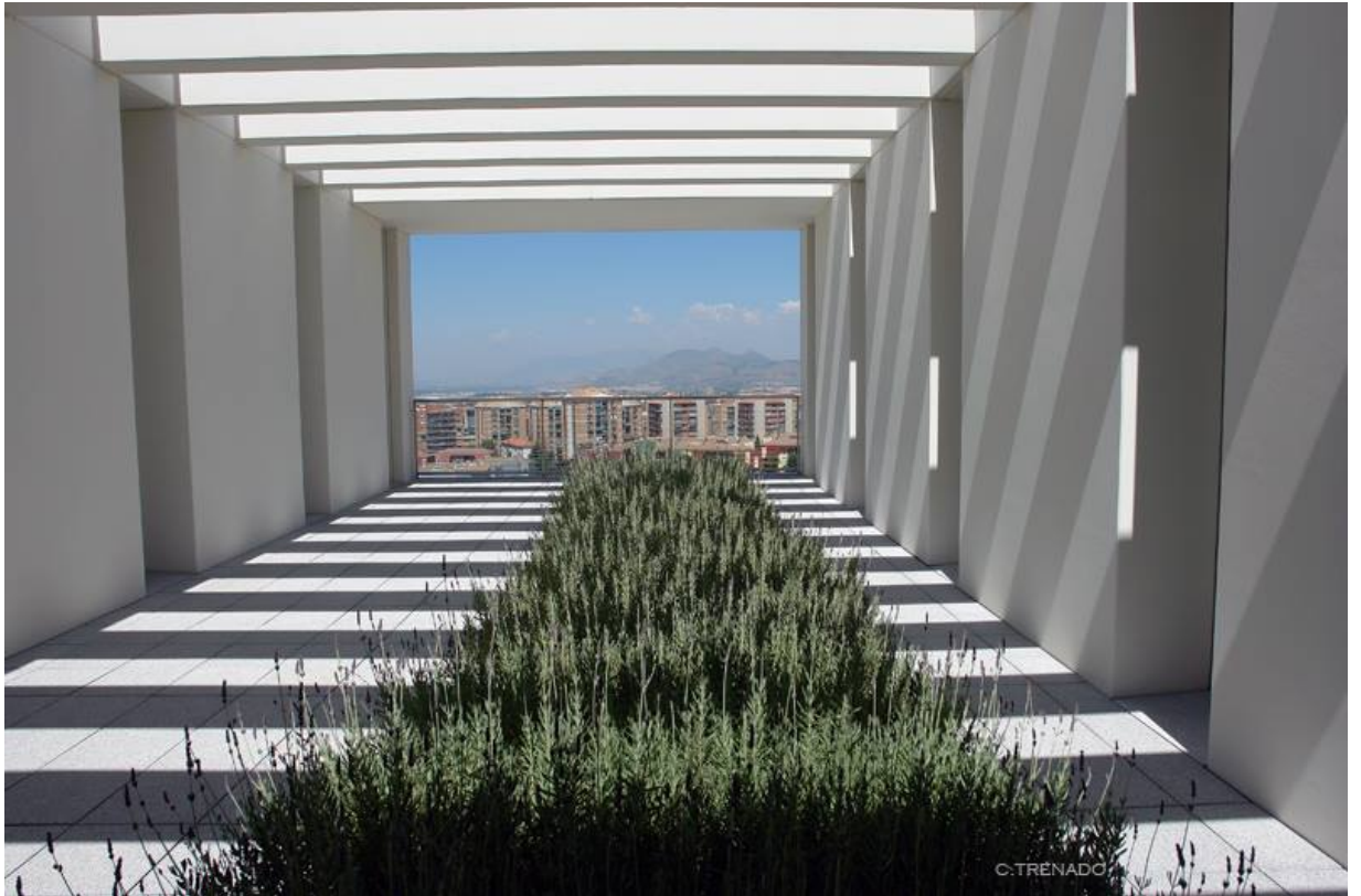
HUM820: Lectura y Escritura en Español