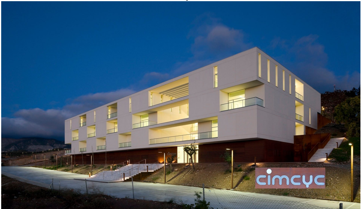
HUM-196: Valores, creencias y actitudes