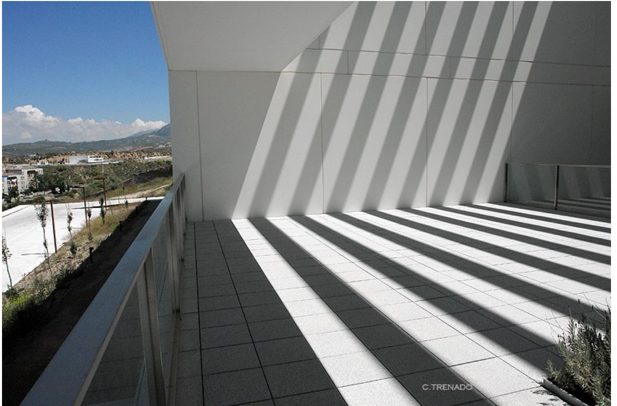
HUM388: Psicofisiología Humana y Salud