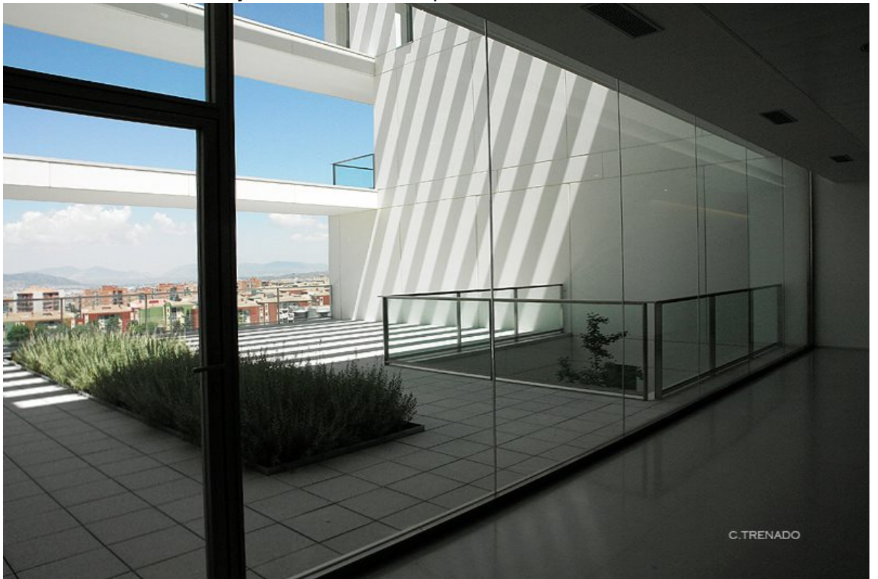
HUM687: Ergonomía y Ciencia Cognitiva