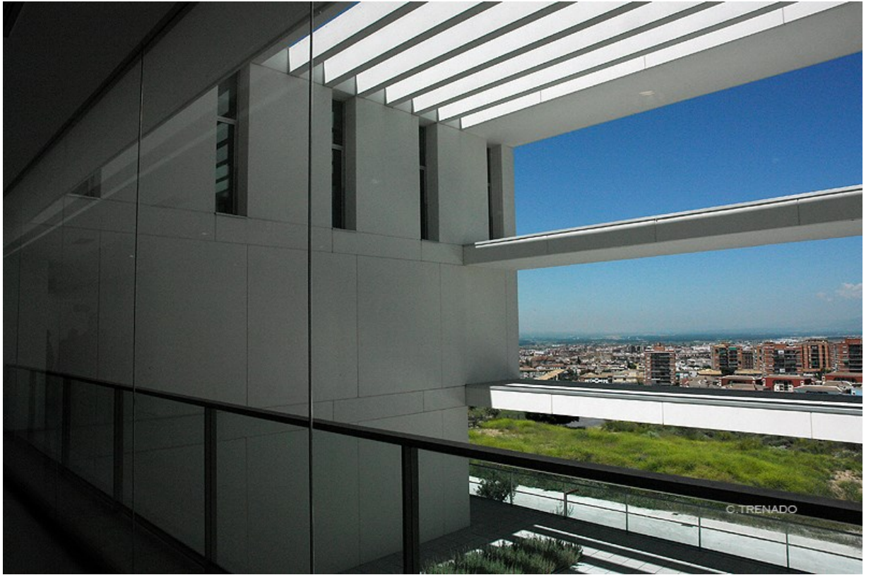
HUM735: Percepción: Seguridad Vial y Lectura