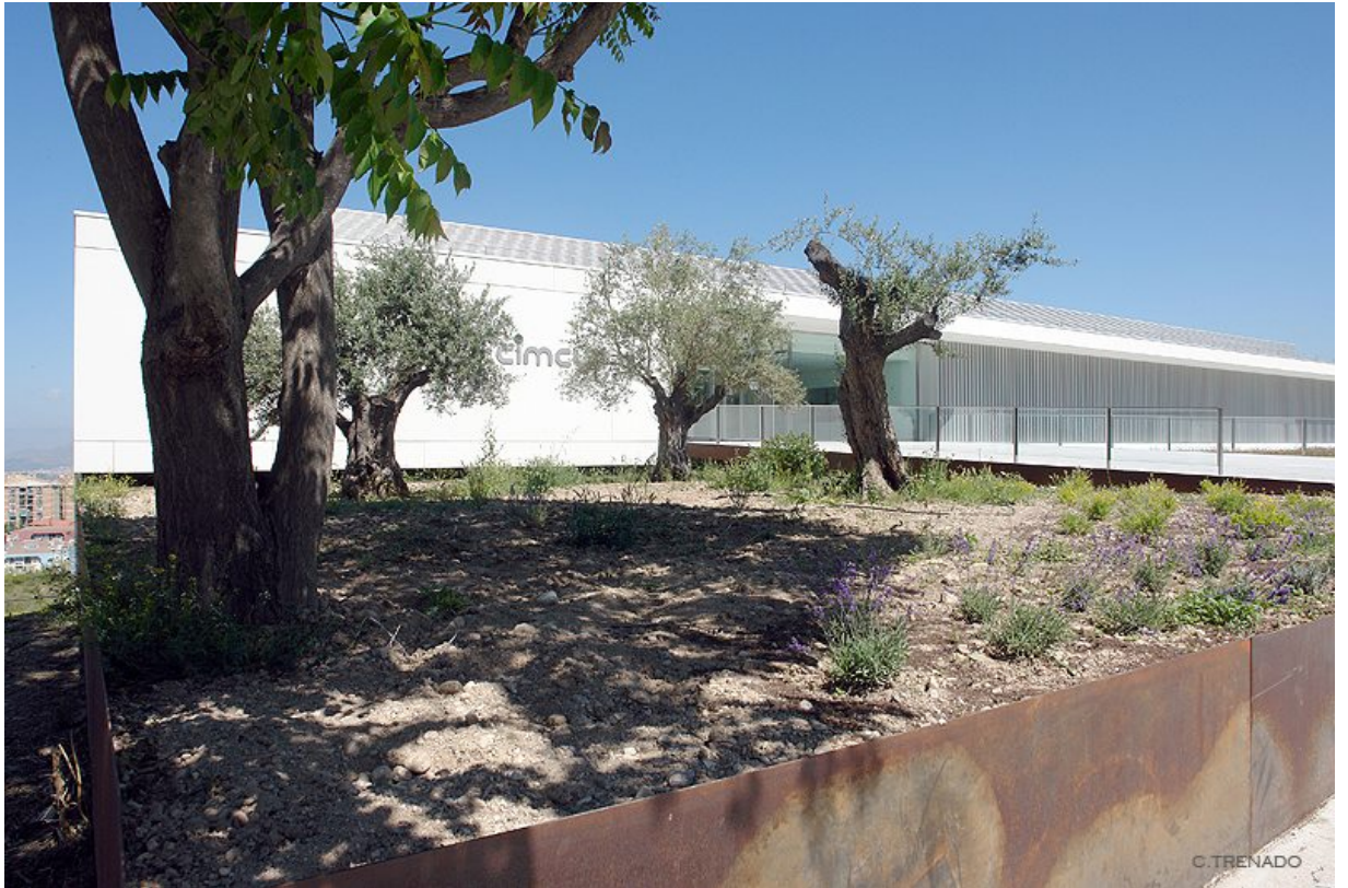
HUM289: Psicología de los Problemas Sociales